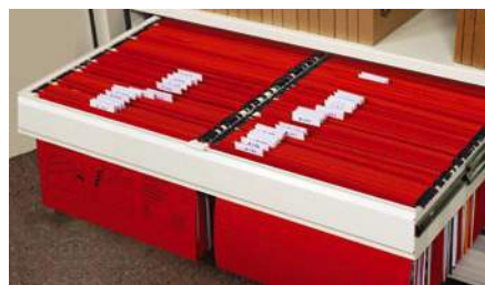
Cadre coulissant pour dossiers suspendus