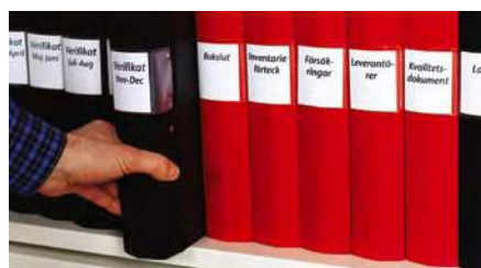
Rangement de classeurs